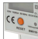
BM01B-L przycisk RESET do kasowania podlicznika