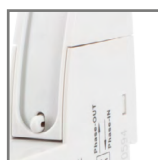
BM015-M/BM015-L pojemność zacisków: 4mm 2