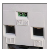
BM01B-L pojemność zacisków: 16mm 2