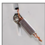
BM01B-L plomba wskaźnika