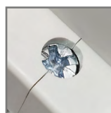
zacziski ze stali ocynkowanej